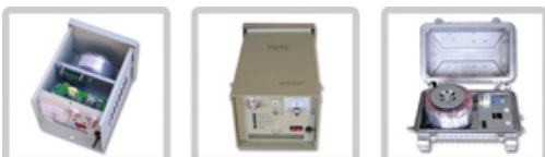
类似产品（从左向右）：FYGD-P，FYGD-MSC 和 FYGD-F 系列。