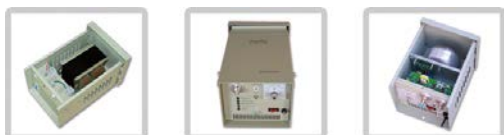
类似产品（从左向右）：FYGD-C，FYGD-MSC 和 FYGD-P 系列。