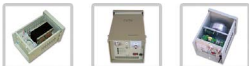
类似产品（从左向右）：FYGD-C，FYGD-MS-C 和 FYGD-P 系列。